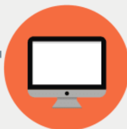
ОПЕРАТОР ПОИСКОВОЙ СИСТЕМЫ